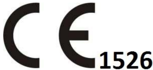
Joonis 2. CE-märgistus TÜV Eesti OÜ identifitseerimisnumbriga.