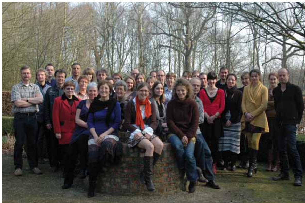
Het enthousiaste TÜV NORD INTEGRA team - maart 2012

Het TÜV NORD INTEGRA-team telt momenteel een 50-tal medewerkers in België. Daarnaast werkt TÜV NORD INTEGRA in het buitenland samen met lokale controleurs & partners die over de nodige kwalificaties beschikken om controles uit te voeren.